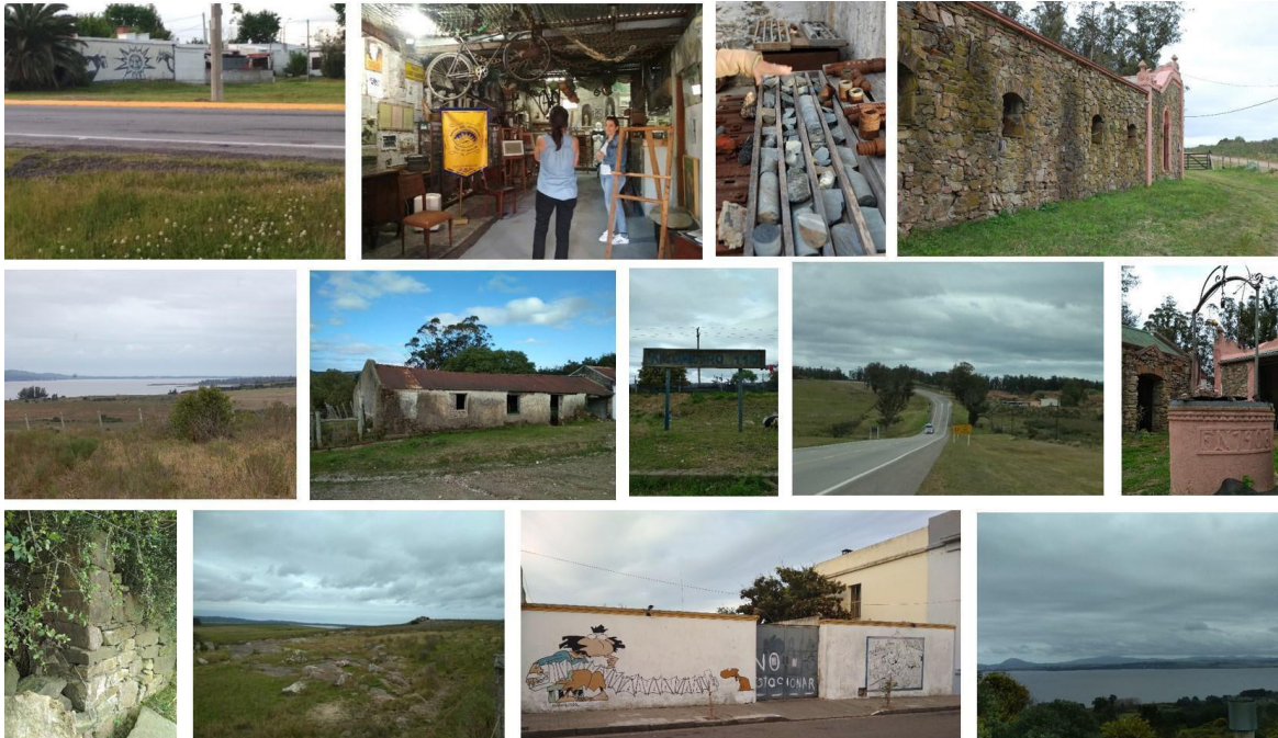
Figura 2. Fotogalería de bienes culturales de la cuenca de la Laguna del Sauce. Figure 2. Photo gallery of cultural assets of the Del Sauce Lagoon basin.

El relevamiento bibliográfico (artículos académicos, publicaciones con información histórica del área, notas de prensa, información en redes sociales), se complementó con dos salidas de campo. La primera, en la que se procuró llevar a cabo un acercamiento