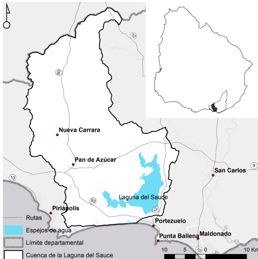
Figura 1. Localización de la cuenca de Laguna del Sauce en el Departamento de Maldonado (adaptado de Steffen & Inda, 2010).

La historia del uso y ocupación humana de este territorio ha dejado una infinidad de vestigios materiales: desde estructuras de piedra de origen indígena -vichaderos y cairnes-, caleras y caminos de la época